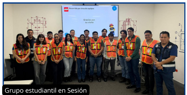
Grupo estudiantil en Sesión