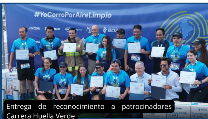
Entrega de reconocimiento a patrocinadores Carrera Huella Verde

Al acercarnos al cierre de este año, ASHRAE, queremos agradecer sinceramente a todas las personas y empresas que participaron y apoyaron nuestras diferentes iniciativas. Gracias a su compromiso, seguimos contribuyendo al desarrollo de tecnologías, investigaciones y estándares que buscan mejorar la calidad de vida de las personas a través de mejores prácticas en la industria HVAC&R. La 3ra Edición de la carrera Huella Verde se convirtió en un verdadero éxito para nuestra comunidad. Más de 2,000 participantes se sumaron a esta causa, demostrando que cada vez somos más las personas comprometidas con generar conciencia sobre la reducción de la huella de carbono y la construcción de un futuro más sustentable. La carrera Huella Verde no solo representó un evento deportivo y familiar, sino también una oportunidad para promover el mensaje de ASHRAE sobre la importancia de los edificios sustentables, la eficiencia energética y la mejora de la calidad del aire interior. Cada participante, patrocinador y voluntario formó parte de un movimiento que busca inspirar acciones positivas para el cuidado del medio ambiente y la salud de nuestras comunidades.