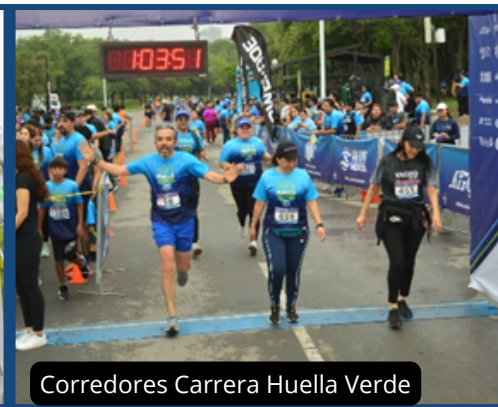
Corredores Carrera Huella Verde

En ASHRAE Monterrey creemos que el cambio comienza con pequeñas acciones que, al unirse, generan grandes resultados. Por ello, seguiremos promoviendo iniciativas que fomenten la sostenibilidad, la educación y la conciencia ambiental dentro y fuera de nuestra comunidad técnica. Esperamos contar nuevamente con su apoyo y participación en la 4ta Edición de Huella Verde, donde continuaremos trabajando juntos por un futuro más limpio, saludable y sustentable para todos.