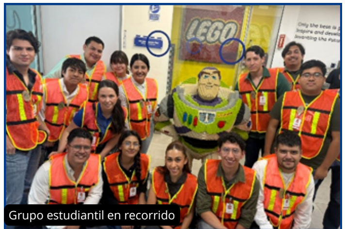
Grupo estudiantil en recorrido