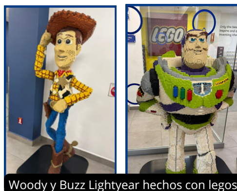
Woody y Buzz Lightyear hechos con legos