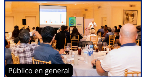
Público en general