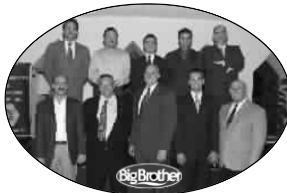
Integrantes del Big Brother ASHRAE Monterrey 2002-2003