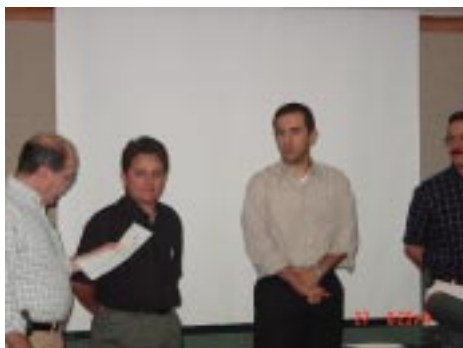
Toma de protesta de la nueva Mesa Directiva