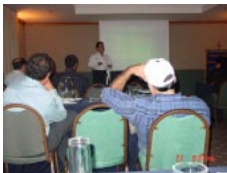
Programa Técnico DHIMEX