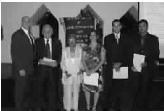
Ganadores: "¡Gracias ASHRAE!" Donald: "¡Gracias suertudos!"