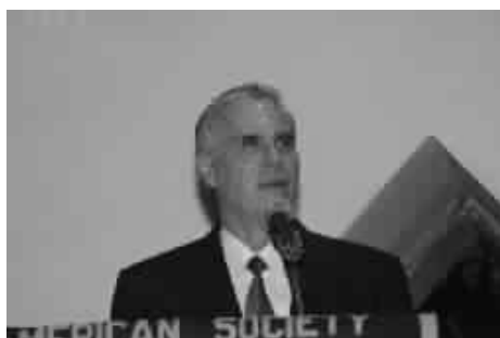
Yo tenía un chorro de voz y ahora solo me quedó un chisquete...