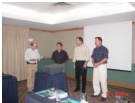
Toma de Protesta de la nueva Mesa Directiva