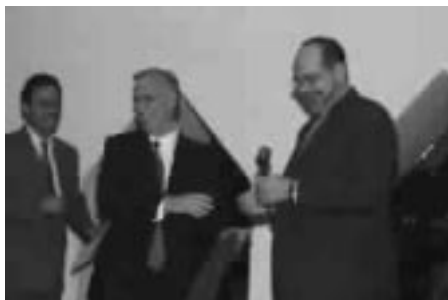
Aquí te dejo tu mallete... ma-lle-te