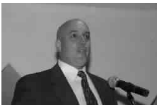
"Agradezco a todos aquellos que compraron sus boletos y a los que no los compraron les agradezco aún más..." (¿Qué habrá querido decir?)