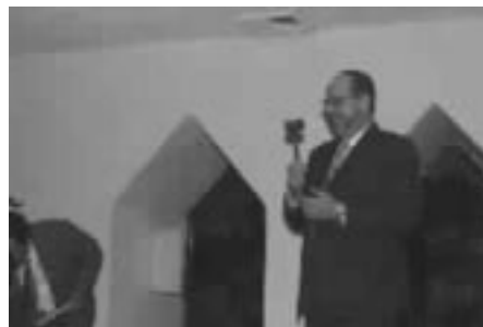
Gracias. Siempre quise tener mi chipote chillón...